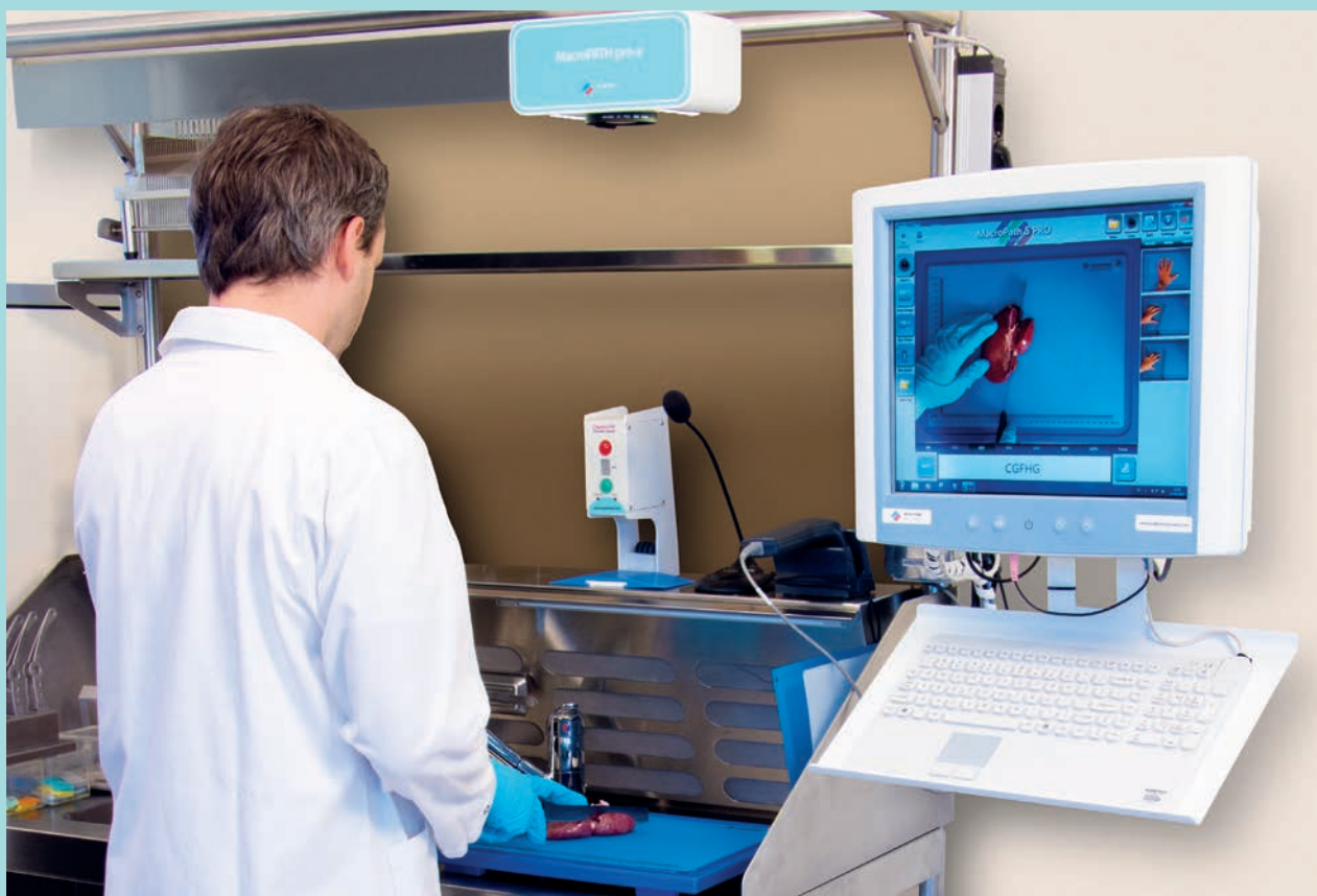
MacroPATH - Macro digital imaging system for the grossing room

Станьте частью этой группы и улучшите свою лабораторию до уровня цифровой!